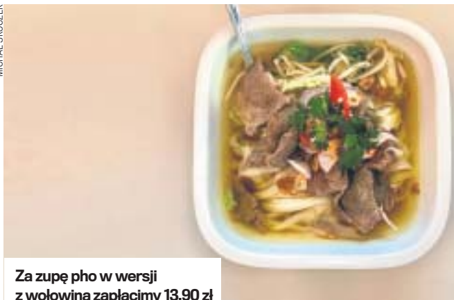
Za zupę pho w wersji z wołowiną zapłacimy 13,90 zł

tyczne. Kalmary - mięcusienkie. Bardzo dobre kimchi - pikantne i chrupiące. Ta sałatka to jedna z najlepszych rzeczy, jakie przywędrowały do nas ze Wschodu. Prawdziwa bomba witaminowa, a do tego bardzo smaczna. Świetne okazały się także sosy - jest ich kilka, od łagodnych po ostre, doskonale podkreślały smak potraw.