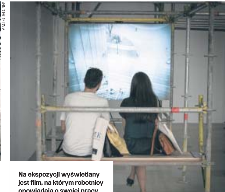
Tak kielecka wystawa prezentowała się w Wenecji